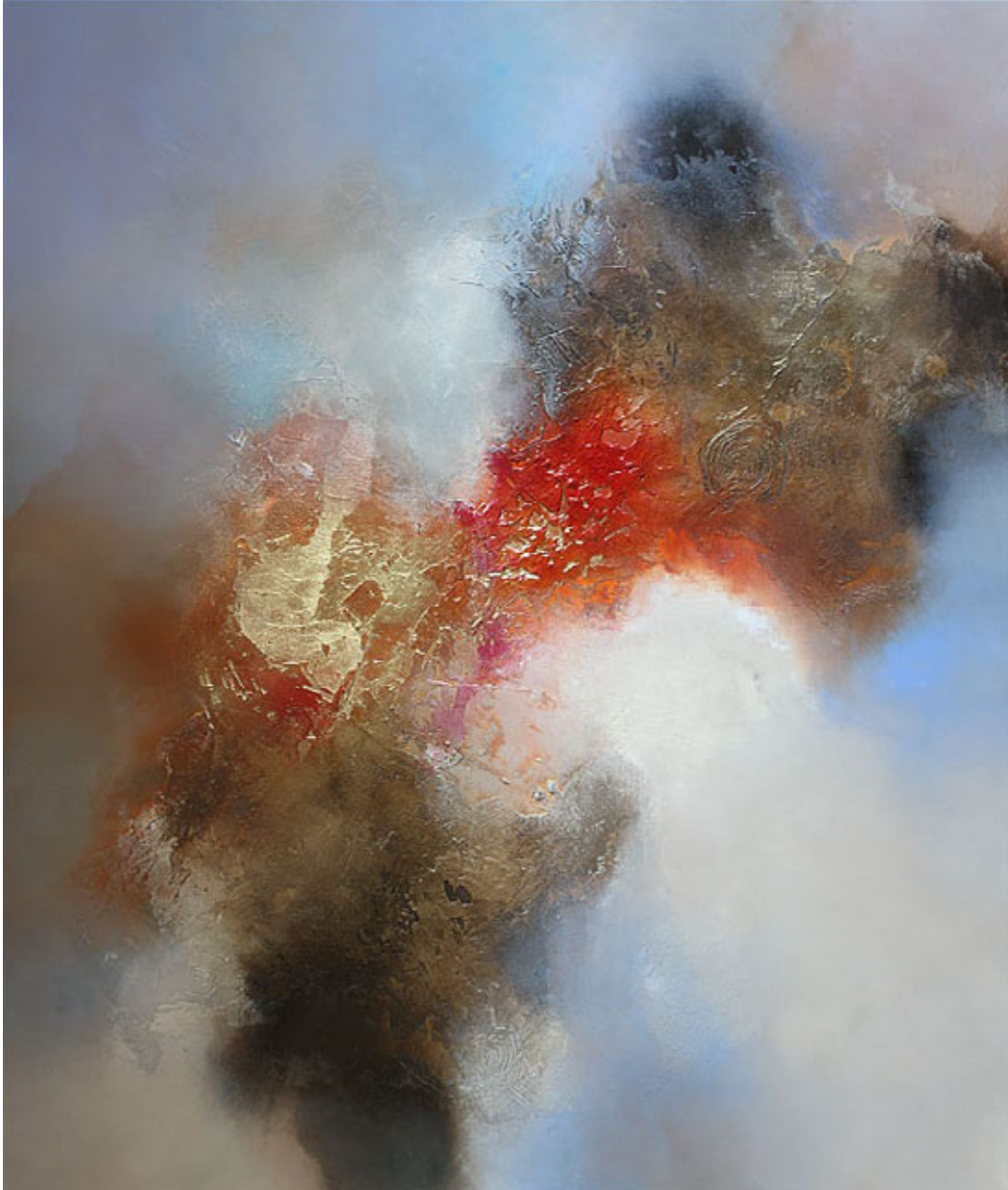
Panta Rhei, mixed media op doek, 120 x 140 cm