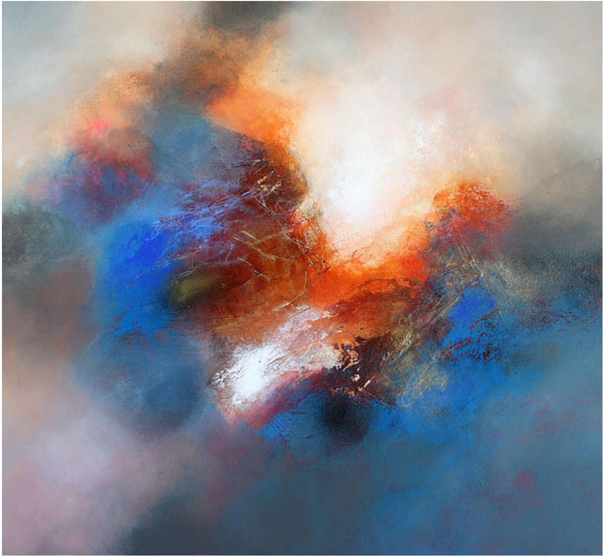
Terra Azul, mixed media op doek, 110 x 120 cm