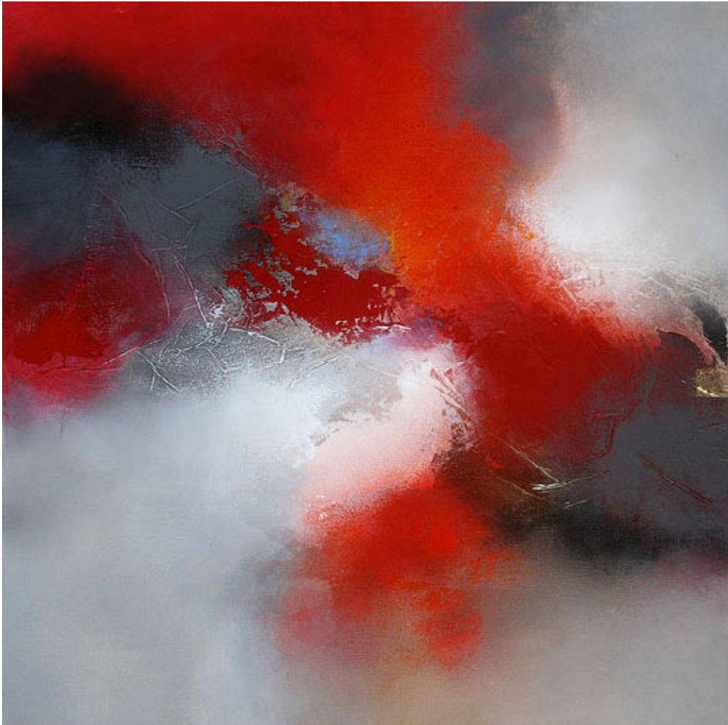
Autumn tale , mixed media op doek, 80 x 80 cm