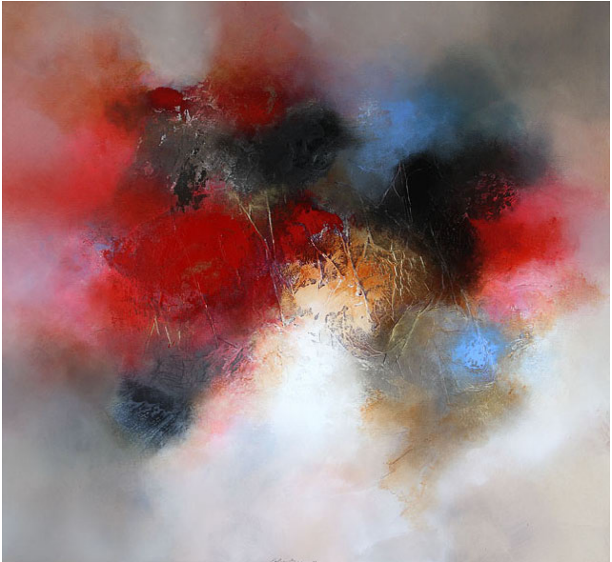
Rosy little universe, mixed media op doek, 110 x 120 cm