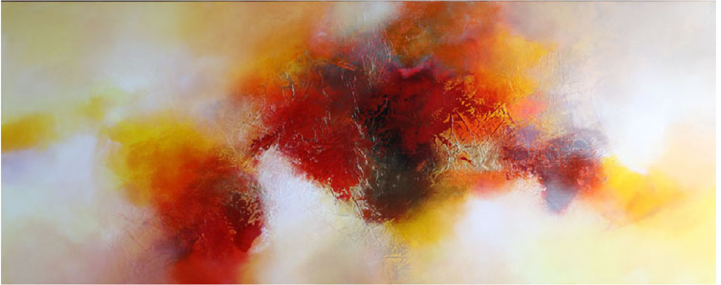
Summerlight, mixed media op doek, 80 x 200 cm