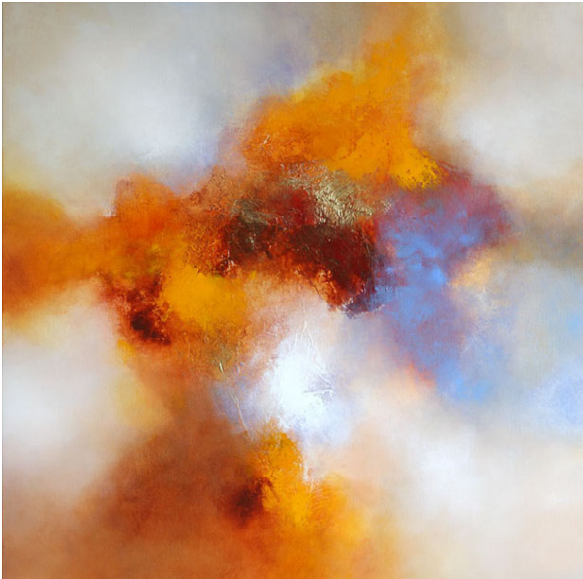
Voyage , mixed media op doek, 110 x 110 cm