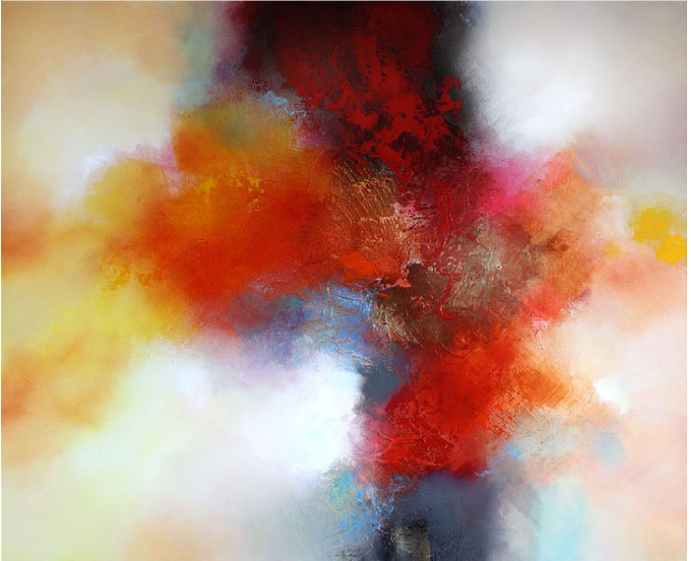
The crystal horizon, mixed media op doek, 115 x 140 cm