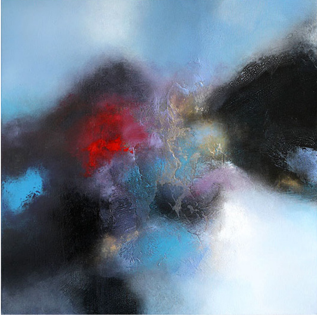
Somnium , mixed media op doek, 80 x 80 cm