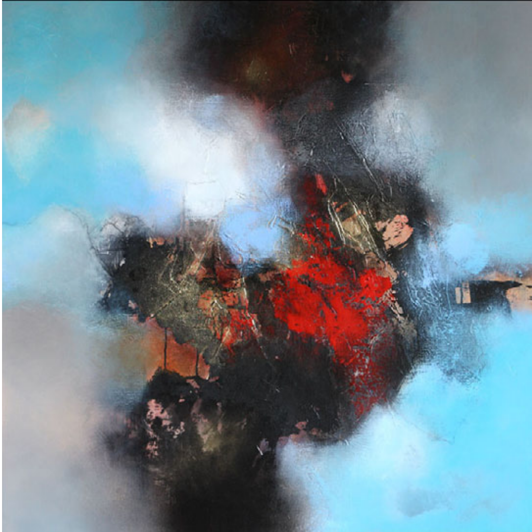
Ocean dreaming, mixed media op doek, 100 x 100 cm