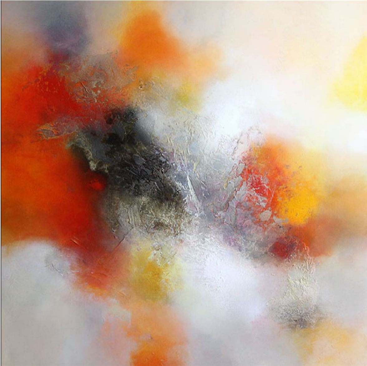
The arrival of summer, mixed media op doek, 120 x 120 cm