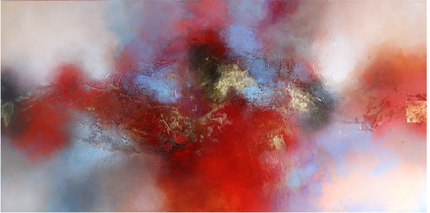
The secret , mixed media op doek, 80 x 160 cm