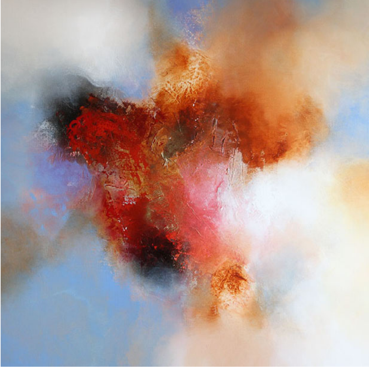
Journey , mixed media op doek, 110 x 110 cm