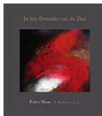
Eelco Maan Basse, september 2006

Voor de kunstenaar is het ultieme schilderij wat voor de alchemist de 'Steen der Wijzen' is: een poort naar de ziel.